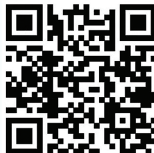
12398APP (安卓版) 二维码