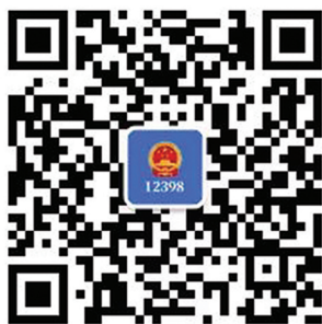
12398能源监管热线 微信公众号